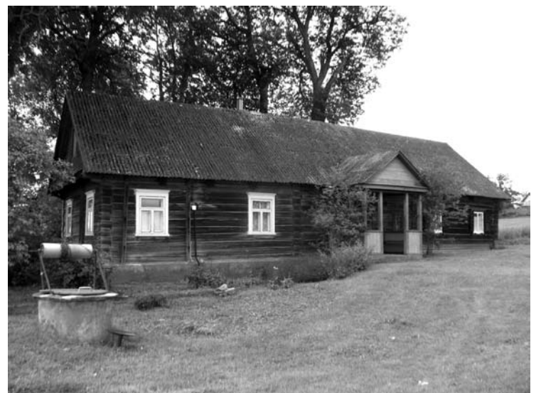
Ši aukštaitiška dviejų galų troba - Pakštų giminės lizdas Butėnuose.